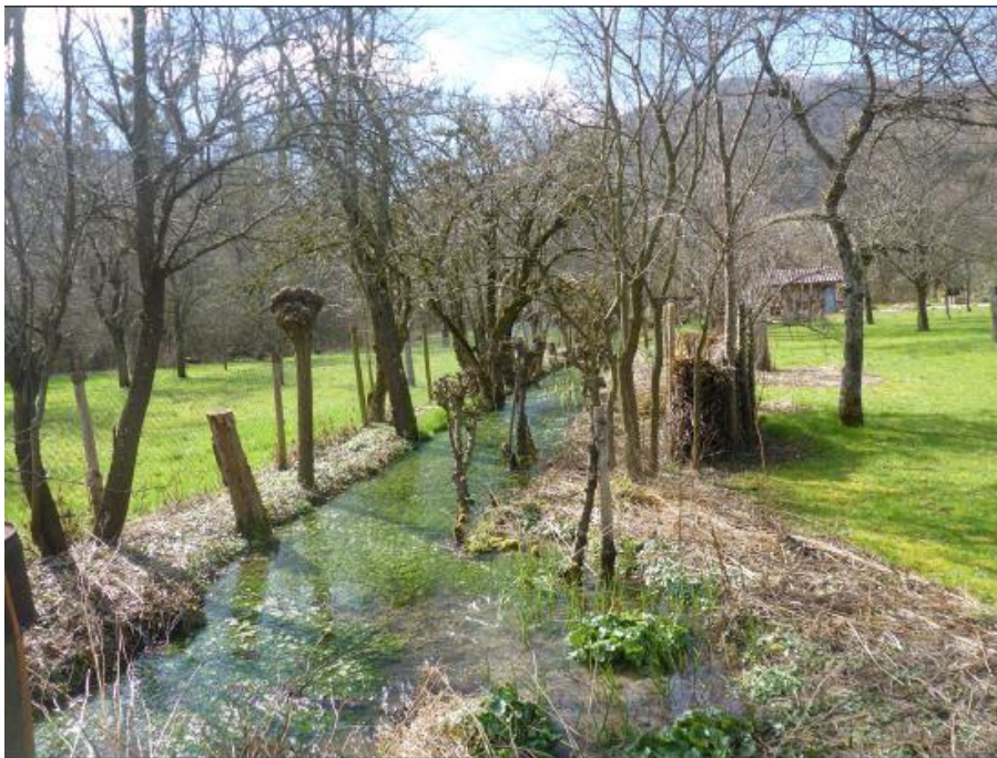
Echaztal: Wässerwiesen oberhalb von Pfullingen. Kanal von Talrand zur Echaz.